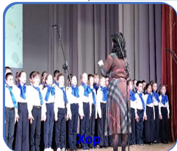
Хор «Веселые горошины»