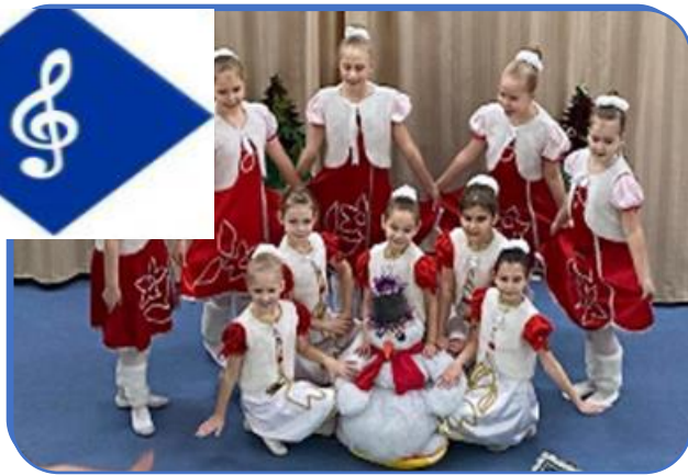
Танцевальный коллектив «Вега»