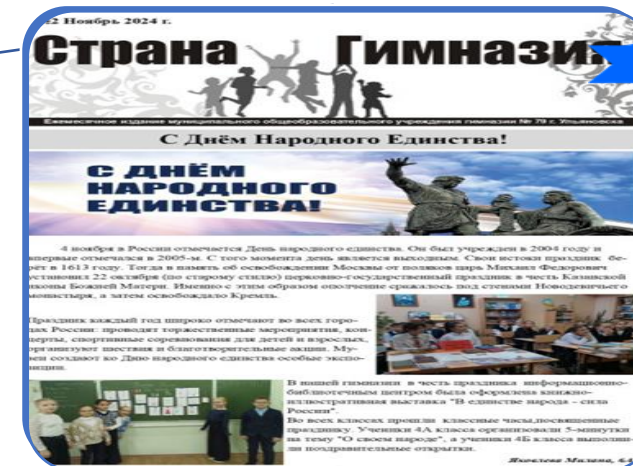
Медиа студия «Взгляд»