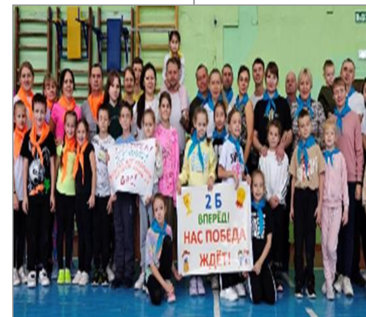
Спортивные соревнования «Папа, мама, я – спортивная семья!»