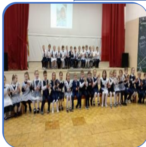
Оркестр русских народных инструментов «Наигрыш»