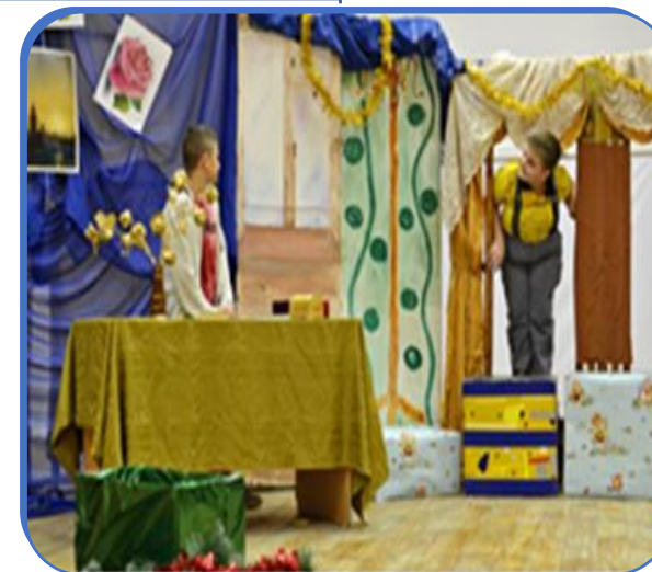
Театральная студия «Успех»